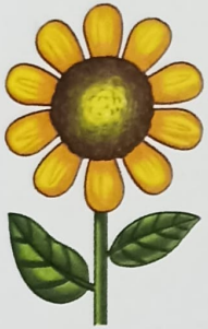
a bright flower