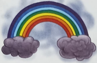
a colourful rainbow