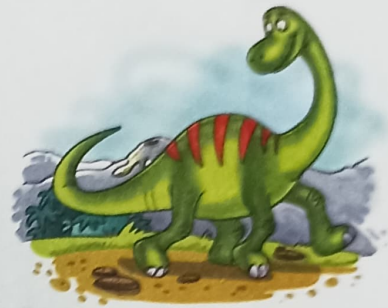
a huge dinosaur

The words rainbow , building , flower , mango and dinosaur are naming words or nouns. The words colourful , tall , bright , ripe and huge tell us more about these nouns. They are called describing words or adjectives .