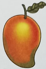
a ripe mango